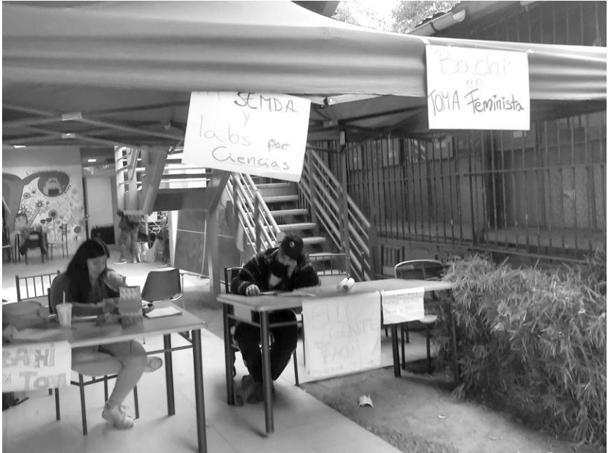
写真1 占拠中の国立チリ大学キャンパスの様子（2018年5月16日）

ピアなど、全国の各都市にも広がった。一連の行動はマスコミでも大きく取り上げられ、女子学生たちの姿は新聞の一面を飾り、テレビやラジオでは討論番組も企画されるなど、このムーブメントは「tsunami」に形容される社会的インパクトをもたらした。